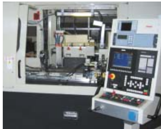
Das von Hanchuan Machine Tool ausgewählte Schleifzentrum wird von einem CNC-System des Typs Num Power 1050 gesteuert.

Wenn ein chinesischer Maschinenbauer bei einem europäischen Hersteller eine Maschine kaufen möchte, so wird diese Wahl sicherlich durch die Entfernung sehr erschwert. Hanchuan Machine Tool hat sich dennoch zur Fertigung seiner Spindeln und Werkzeugaufnahmen für die Partner Morara und Num entschieden.