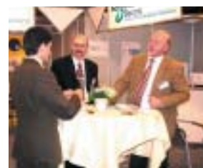
Stand der Firma Num anlässlich der 4. Internationalen HSC-Fachtage in Darmstadt

und Werkzeugmaschinen) der Universität Darmstadt ausgerichtet wurde. Ungefähr im selben Zeitraum fand die HSC-Fachtagung der I.U.T. (Fachhochschule) der Region Limousin in Limoge (Frankreich) statt. Hier stellten die Ingenieure der Firma Num ihre neuesten Axiom Power-Systeme vor und demonstrierten, dass es bei der Hochgeschwindigkeitsbearbeitung nicht alleine um hohe Geschwindigkeit geht, sondern dass vor allem das Abbremsen beherrscht werden muss. Anlässlich der 11. HSC-Fachtage in Steyr (Österreich), die erst vor kurzem stattfanden, unterstrich Num die Bedeutung der Einstellung der Regelkreise, um schnelle und präzise Bearbeitung zu gewährleisten.