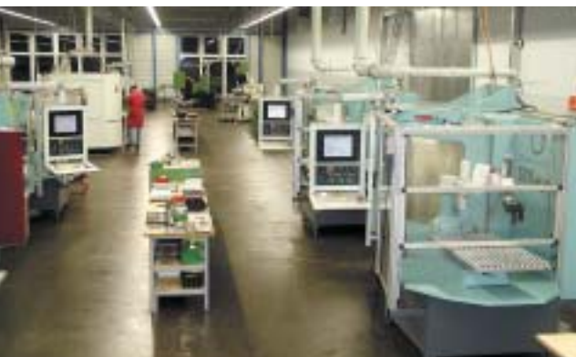
Der Maschinenpark der Firma Günther Wirth umfasst mehrere Werkzeugschleifmaschinen, die allesamt von Num-Steuersystemen gesteuert werden und mit der Software NUMROTOplus® ausgerüstet sind.

25 verschiedene Maschinentypen gibt es zur Zeit mit NUMROTOplus®, der Standardlösung für das Werkzeugschleifen. Bei Schleifmaschinen mit Beladesystem wird von nun an das Softwaremodul NUMROTOplus® Control integriert, mit dessen Hilfe die Produktion automatisch und sicher verwaltet werden kann.