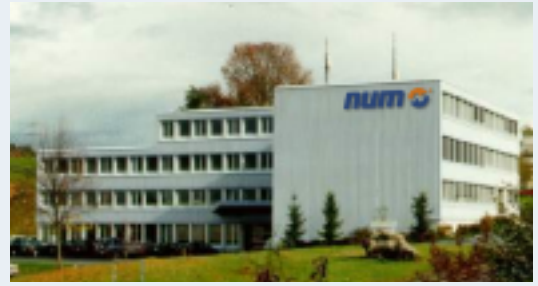
La sede principale del gruppo NUM è la NUM AG CH Teufen AR, presso San Gallo.

Come in precedenza, nei singoli paesi sono gli MTC locali (Machine Technology Center) ad occuparsi dell'assistenza ai nostri partner. Gli MTC locali sono responsabili della completezza dei servizi nell'ambito delle vendite, delle soluzioni applicative e dell'assistenza.