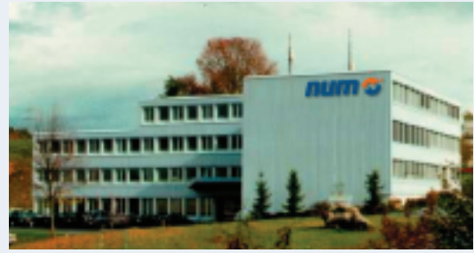
Hauptsitz der NUM-Gruppe ist bei NUM AG, CH Teufen AR, Nähe von St.Gallen

In den verschiedenen Ländern sind wie bisher die lokalen MTC's (Machine Technology Center) für die Betreuung unserer Partner zuständig. Die lokalen MTC's sind für eine umfassende Dienstleistung in Vertrieb, Applikationslösungen und Service verantwortlich.